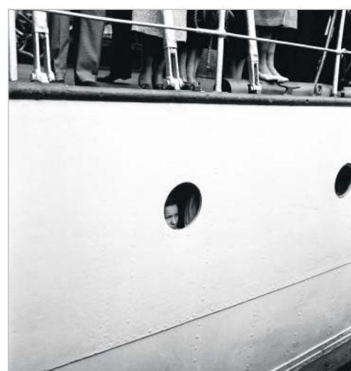
Aho &amp; Soldan kuvasi paljon matkailuaiheita.

Vaikka Suomi näissä näyttelyissä näyttää-