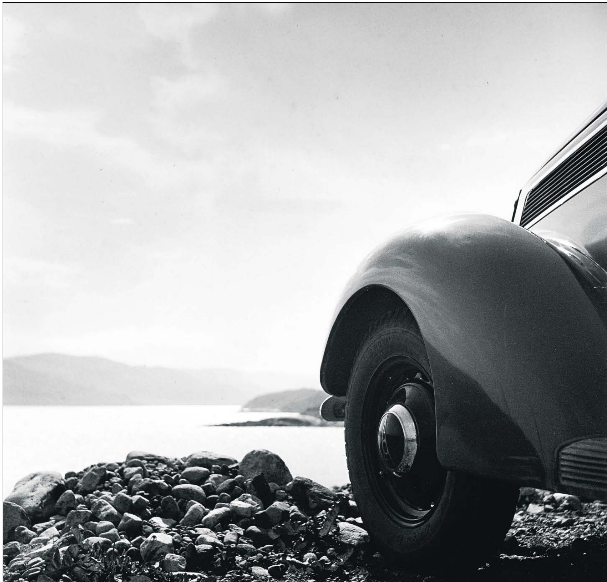
Aho &amp; Soldanin kuvissa on usein auto modernin elämän symbolina. Auto on mukana myös Lapin maisemakuvassa.