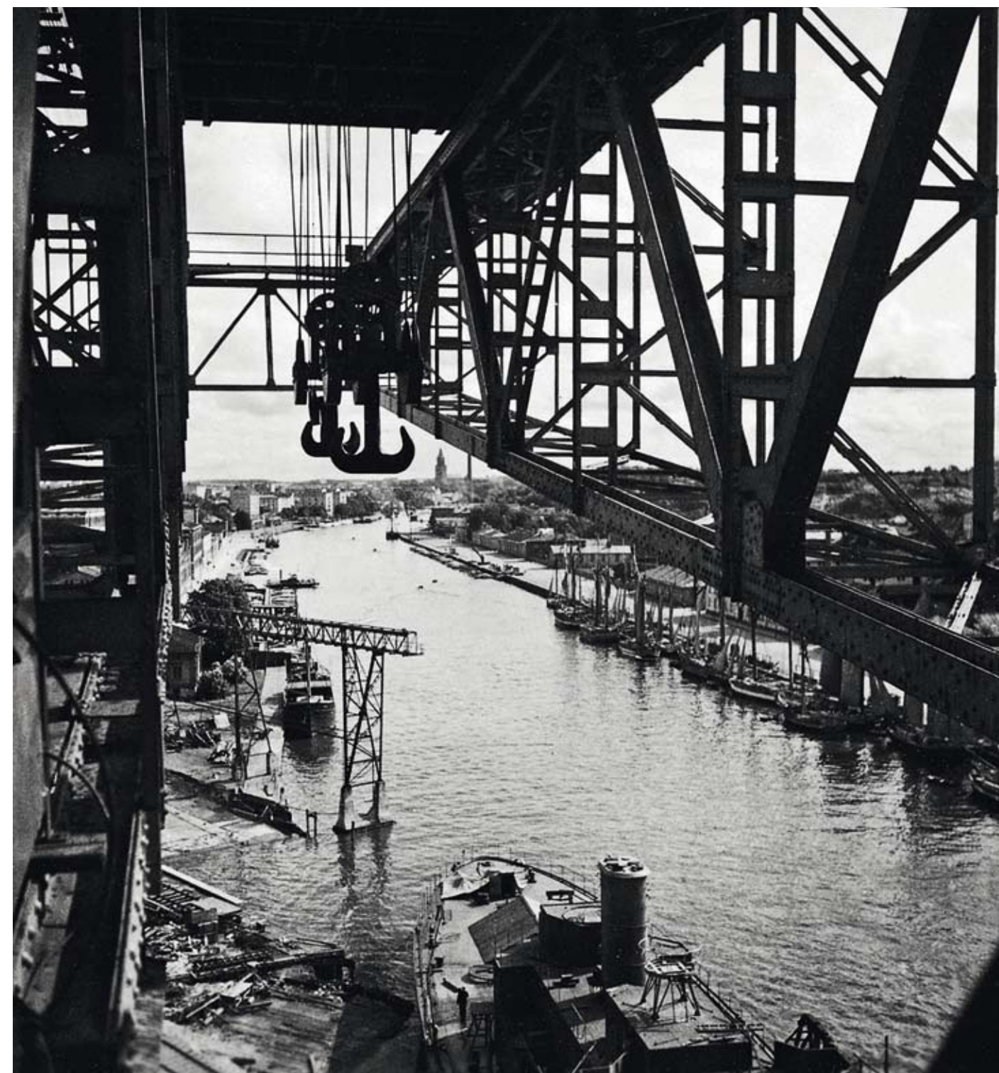
Vientisatama. Aurajoen maisema Turusta (1930-luku).

1930-luku oli Elokuvayhtiö Aho & Soldanin loistoaikaa. Yhtiö oli alallaan Suomen ykkönen. Se valmisti teollisuuselokuvia, ikuisti maamme kasvot ja tallensi elokuviksi suuren laman jälkeisen nousukauden. Veljekset astuivat ripeää tahtia Suomen kuvaamisen ja tallentamisen historiaan. Veljesten käsi-