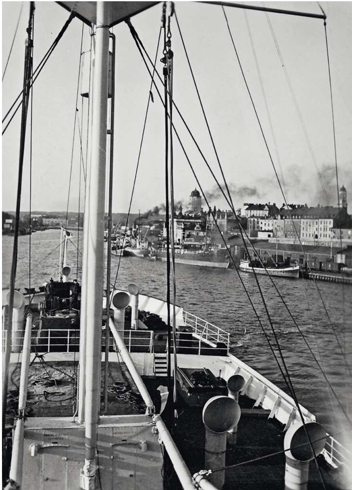
Kansainvälinen kaupunki. Viipurin satama ja kaupunki laivan kannelta kuvattuna (1930-luku).