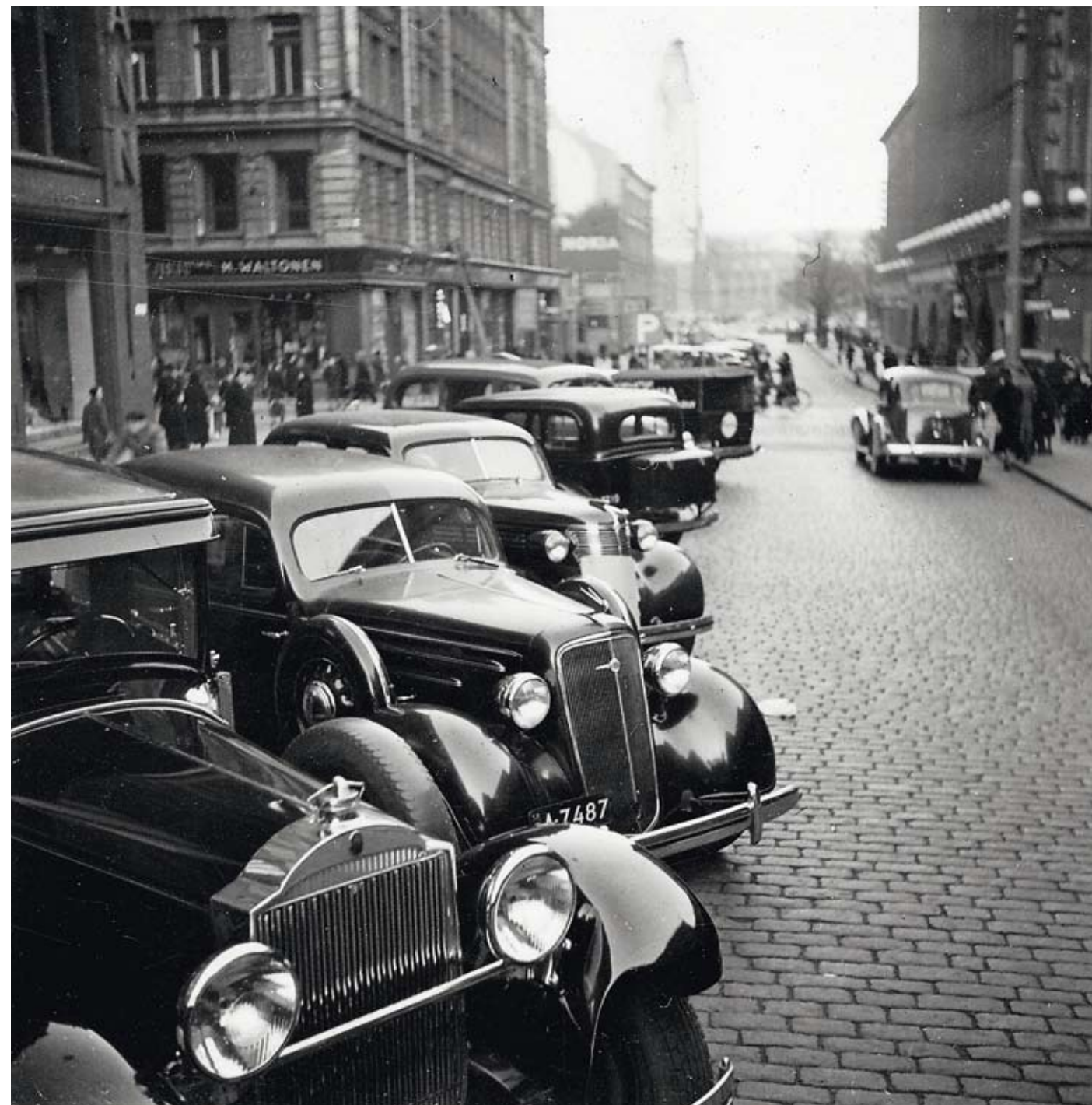
Autot saavuttivat Suomen. Suomi pyöriillä Helsingin Keskuskadulla (1930-luku).

”Juhani Ahon juhluvuosi on tärkeä siksikin, että mielestäni hän on ollut hiukan varjossa. Ahon kirjalliseen tuotantoon kannattaa tutustua edelleen. Se on kestänyt aikaa.”