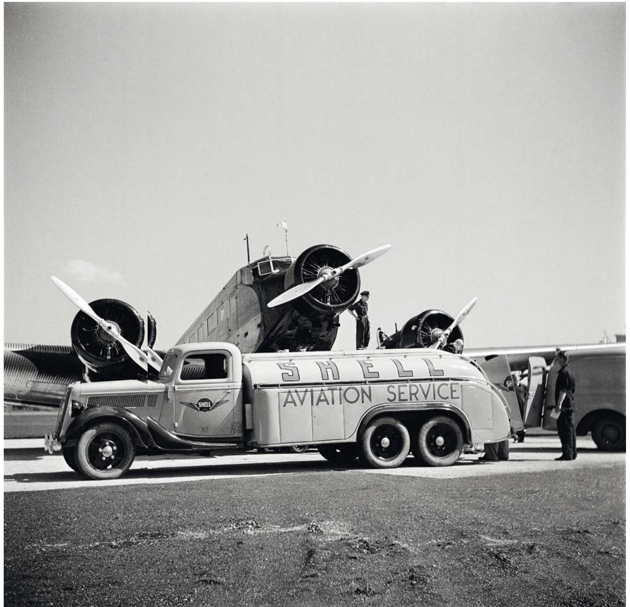
Taivas auki Eurooppaan. Aeron Junkers Ju 52 saa polttoainetta (1930-luku).

1930-luvun alkaessa veljesten yhtiö tarttui pitkiin dokumentteihin. Kahden vuoden uurastus ja silmitön matkustus tuon ajan huterilla liikenneyhteyksillä huipentui kolmeen elokuvaan. Ensi iltansa saivat Suomen puu- ja paperiteollisuus , Suomen maatalous ja Raudanjalostusta Suomessa . Metsä- >>