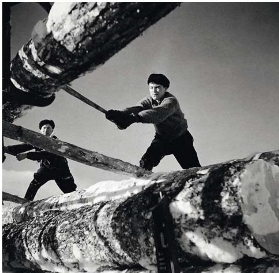
Ahkerä kansa. Miehet ja tukit luovat kuvaa Suomesta. Kuva oli esillä New Yorkin 1939–1940 maailmannäyttelyn Suomen paviljongissa.